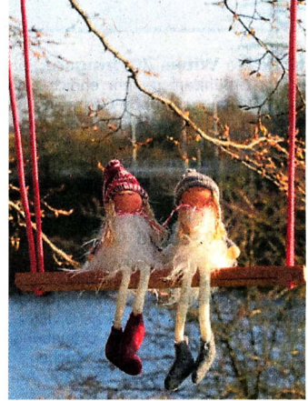
In den Bäumen sind ebenfalls Weihnachtswichtel zu finden – zum Beispiel auf einer Schaukel.

ten Hafen, eine Ganztagsgrundschule, eine schöne Kindertagesstätte und einen tollen Gemeinschaftsplatz, auf dem die Kinder gerne spielen“ – so beginnt das „Märchen“, das sich der Förderverein ausgedacht hat. Weihnachtsmännchen und Wichtel